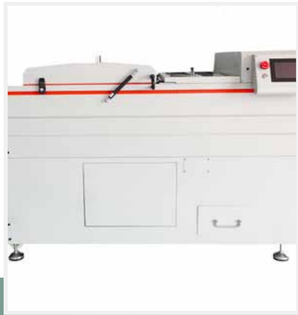
Tam Otomatik Kontrol Sistemi

ve kişiselleştirilmiş ürünler oluşturun.