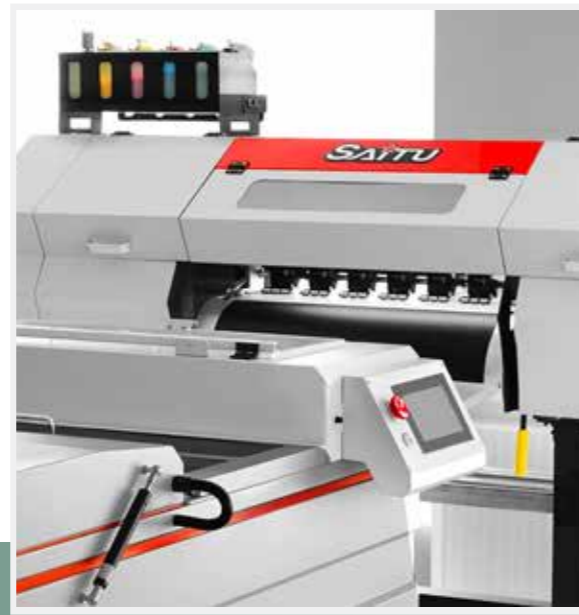
Dokunmatik Kontrol Paneli